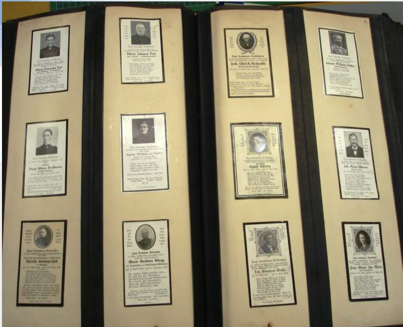
Wir sind auch im Besitz einer grossen Sammlung alter Trauerbildchen